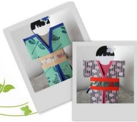
Karte „Mädchen im Kimono“